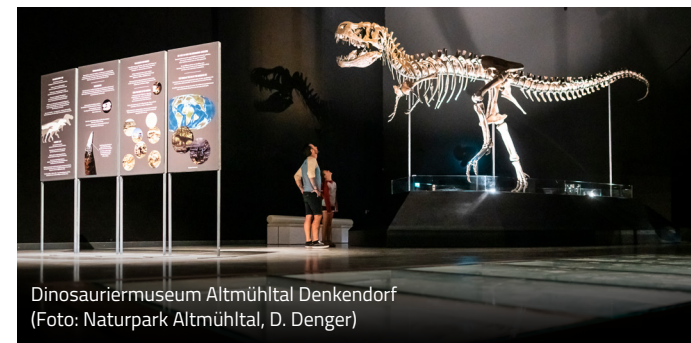
Dinosauriermuseum Altmühltal Denkendorf