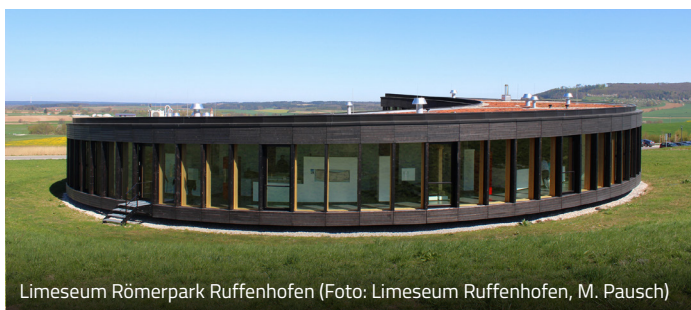
Limeseum Römerpark Ruffenhofen