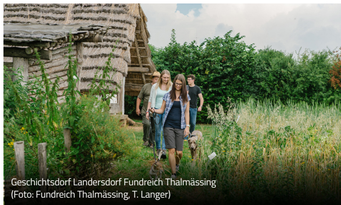
Geschichtsdorf Landersdorf Fundreich Thalmässing