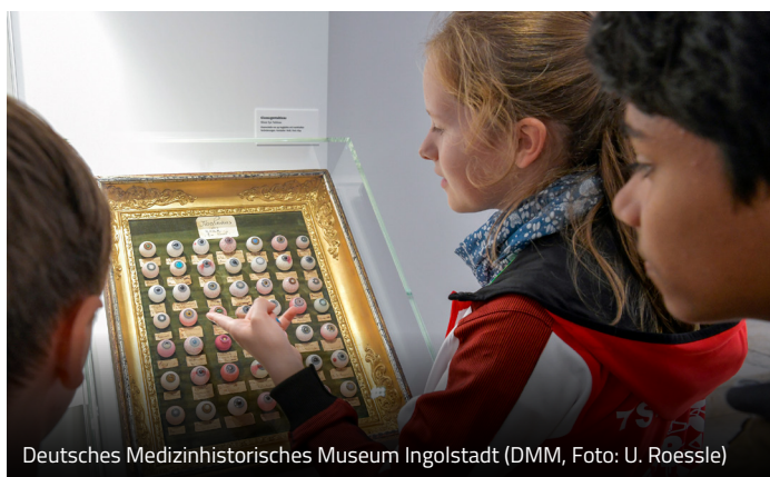
Deutsches Medizinhistorisches Museum Ingolstadt (DMM)