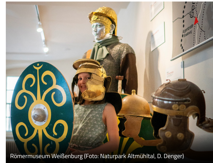
Römermuseum Weißenburg