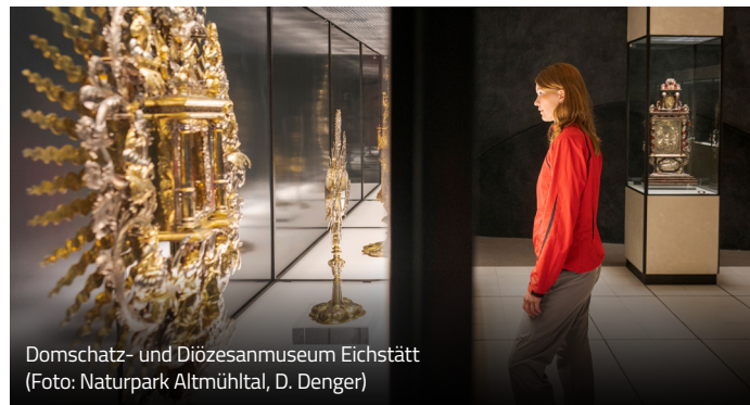
Domschatz- und Diözesanmuseum Eichstätt