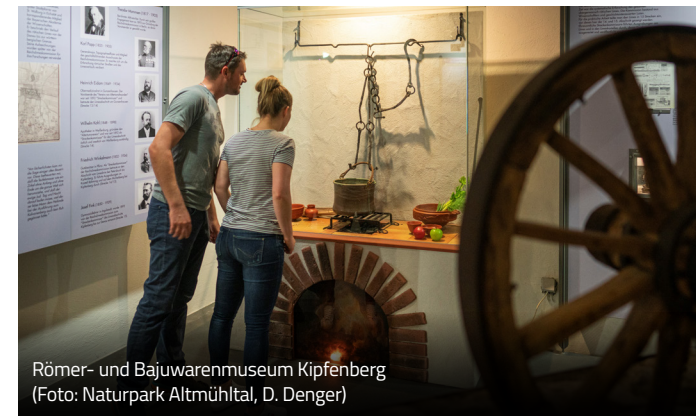
Römer- und Bajuwarenmuseum Kipfenberg

Mehr Infos und Anmeldung auf bajuwaren-kipfenberg.de und unter 08465 905707