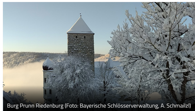
Burg Prunn Riedenburg

Mehr Infos auf burg-prunn.de und unter 08442 3323